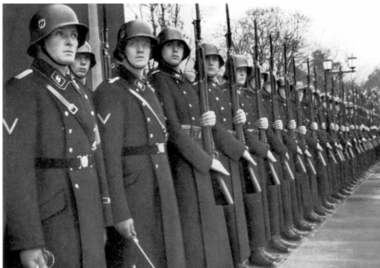
Первый этап создания сверхчеловека: отборные подразделения СС в почетном карауле в Берлине

го контроля, что было ценно для него как главы СС. Гиммлер говорил, что карма требует только того, чтобы человек исполнял свои обязанности, не беспокоясь о последствиях. Он усвоил восточное представление о том, что человек может отделиться от этого мира при помощи медитации. 10