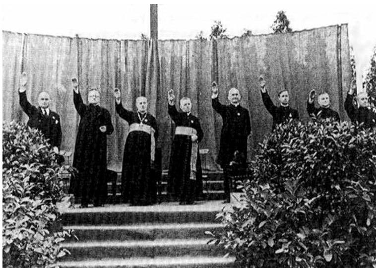
Священники новой Германии приветствуют Гитлера

Так же как и Гитлер, антихрист будет добиваться поклонения себе. В начале периода великой скорби он заключит завет с Израилем, который, очевидно, будет гарантировать этой маленькой, но весьма значимой стране мирное существование. Однако через три с половиной года у него будет достаточно решимости в том, чтобы прибыть в Иерусалим и нарушить свое соглашение. Он войдет в храм, который будет к тому времени восстановлен, осквернит его и объявит себя Богом. Павел описывает его как «противящегося и превозносящегося выше всего, называемого Богом