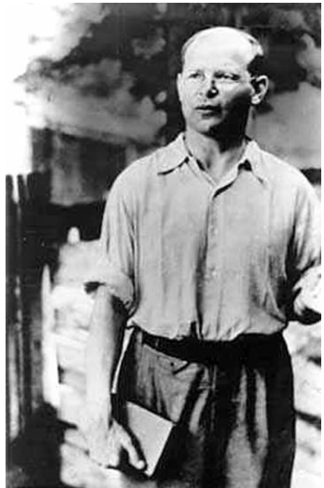
Дитрих Бонхёффер летом перед казнью во дворе тюрьмы Тегель

Семья Бонхёффера верила в христианское благочестие, однако церковь не посещала. Они читали Библию, но только в особых случаях. Водное крещение и конфирмация были для них важны, однако посещение церкви рассматривалось как необязательное и излишнее для приверженности высшим идеалам. Вполне понятно, что для семьи стало неожиданностью заявление Ди-