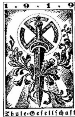
Титульный лист брошюры общества «Туле»

Это слова, сказанные Дитрихом Эккартом на смертном ложе в 1923 году. Эккарт был одним из семи основателей партии нацистов и посвященным сатанистом; человеком, погруженным в черную магию и весьма близким к группе оккультистов «Туле».