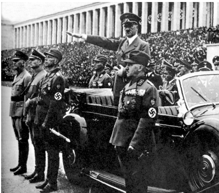
Гитлер принимает парад Трудового фронта, 1935 г.

шу отсюда в Рейх, взрастить его как вождя народа для того, чтобы он смог ввести свою родину в Рейх. Это — руководство свыше... Я чувствовал призыв провидения. И то, что произошло, можно только постичь как исполнение предначертания и воли этого провидения». 2 Это predetermined «руководство свыше» управляло им.