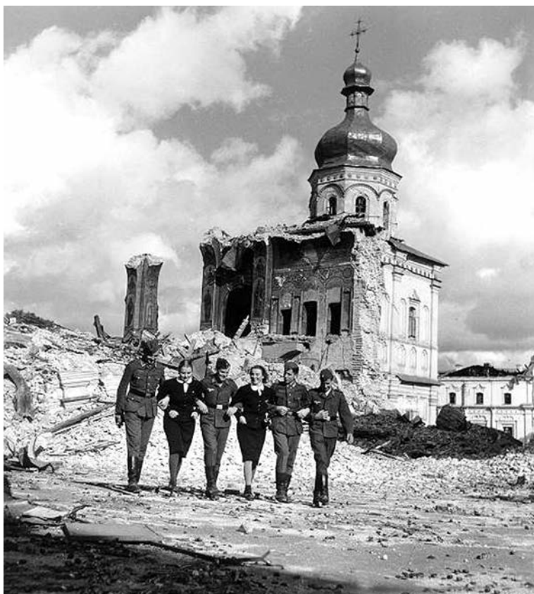
Оккупанты прогуливаются по руинам Успенского собора Киево-Печерской лавры

о самом себе. Крест Христов — это символ человеческой отчужденности от самого себя; напоминание о том, что человек должен примириться с тем собой, которым он уже является.