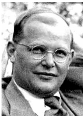
Пастор Дитрих Бонхёффер

зубов, услышал, и чтобы народы возрадовались от того, что церковь Христа во имя Христа забрала оружие из рук их сыновей, воспрепятствовала войне и заявила о мире Христовом в лицо неистовому миру». 6