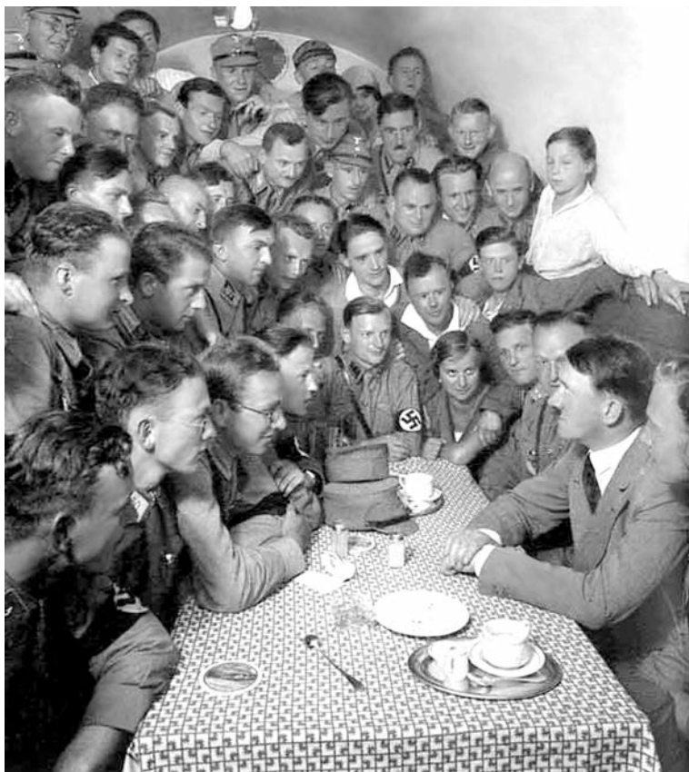
Гитлер с народом за чашкой кофе. Пропагандистский материал Третьего Рейха

Одна женщина, жившая в Германии в эпоху нацизма, отметила: «Гитлер за год сделал больше, чем Веймарская республика за десять лет».