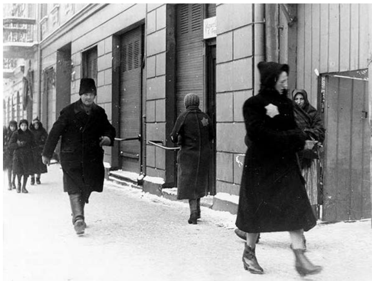
Евреи на улице. Восточная Европа в период немецкой оккупации

В этой книге он объединил теорию Вагнера об арийской расе господ с теорией Ницше о расе сверхчеловеков. Чемберлен верил, что можно вывести «выс-