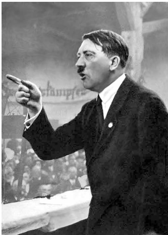
Гитлер проповедует своим первым последователям.

тельством евреев в Первой мировой войне, а теперь новая Германия воскресла в силе и надежде.