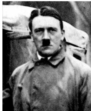
Гитлер выходит из Ландсбергской тюрьмы, 1924 г.

Мировая депрессия 1929 года предоставила Гитлеру возможность, которую он искал. Будучи революционером, он мог преуспеть только в тяжелые времена, когда была высока безработица, бушевала инфляция и вся Германия была наполнена гневом и сомнением.