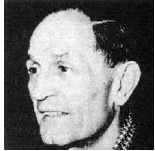
Пастор Мартин Нимёллер, один из выдающихся противников нацизма в Германии

Когда всем пасторам была разослана анкета, в которой они должны были удостоверить свое личное происхождение, Нимёллер отказался пойти на уступки и призвал остальных последовать его примеру. Он знал, что его поступок был проявлением неповиновения государству, но он серьезно относился к словам Писания: «Нет уже Иудея, ни язычника; нет раба, ни свободного; нет мужеского пола, ни женского: ибо