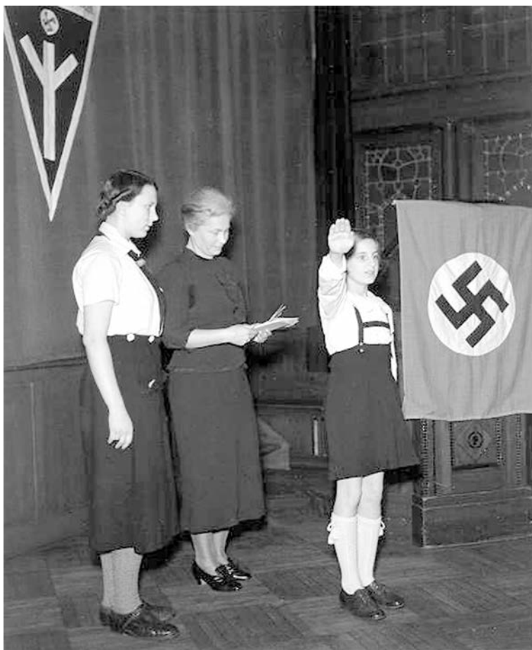
Прием в члены молодежной организации нацистов Гитлерюгенд. На стене висит изображение руны «лебен», что означает «жизнь»

Конечно же, Гитлер выступал с резкой критикой гомосексуалистов, точно так же как и оккультистов, хотя сам был убежденным сатанистом.